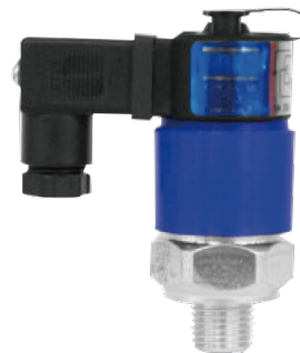
AT-JB (B) 16 x 16